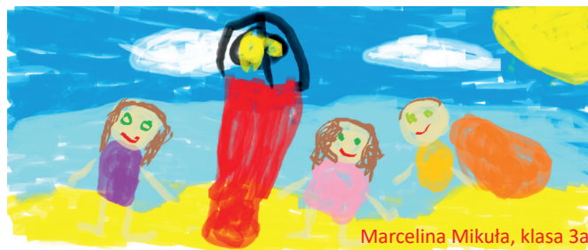
Marcelina Mikula, klasa 3a

Wszystkich uczniów nadal zachęcamy do udziału w zaproponowanych konkursach!