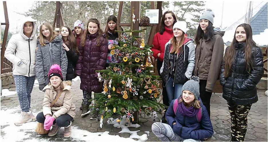
Náš stromček v bojnickej ZOO