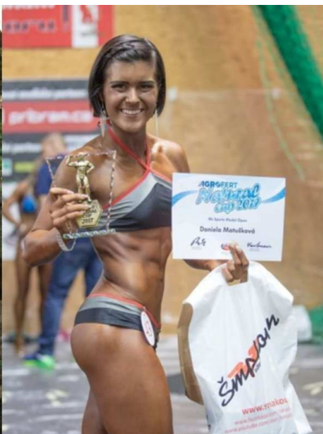
Leina premena - Lea predtým a dnes