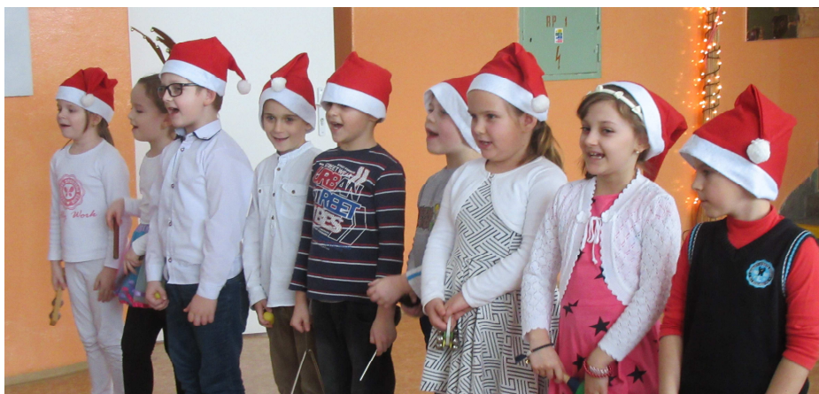
Naši prváci počas vystúpenia