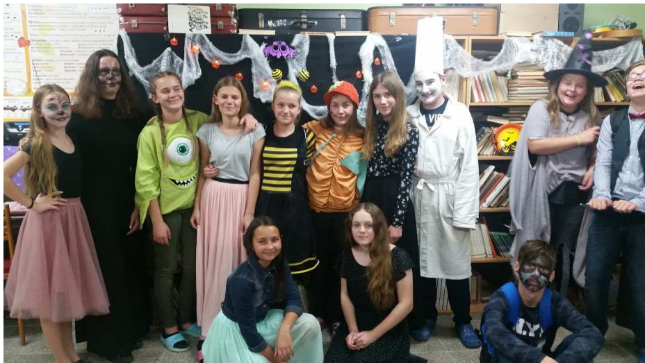
Siedmacky herecký tím