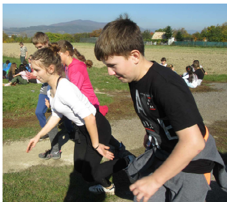
Žiaci 8.A pripravení na štart

Dňa 16. októbra mali žiaci ZŠ s MŠ Koš účelové cvičenie - praktickú časť, ktorá pozostávala z prechádzky a branného preteku. Ten sa skladal z teoretickej časti, kde si preverili svoje vedomosti zo zdravotnej výchovy, bezpečnosti na cestách, pohybu a pobytu v prírode, atď., a z druhej časti, ktorú tvorili úlohy zručnosti a šikovnosti žiakov (hod granátom, prekážkové dráhy, prenos raneného...). Hodnotili sa celkové body družstva a rýchlosť, za ktorú daný okruh absolvovali.