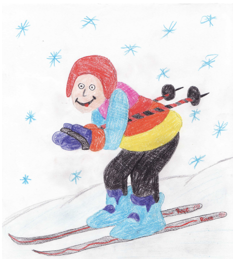
Ilustrácia: Klaudia Zimanová, 7.B