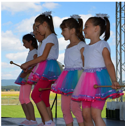
Tanečnice z našej školy