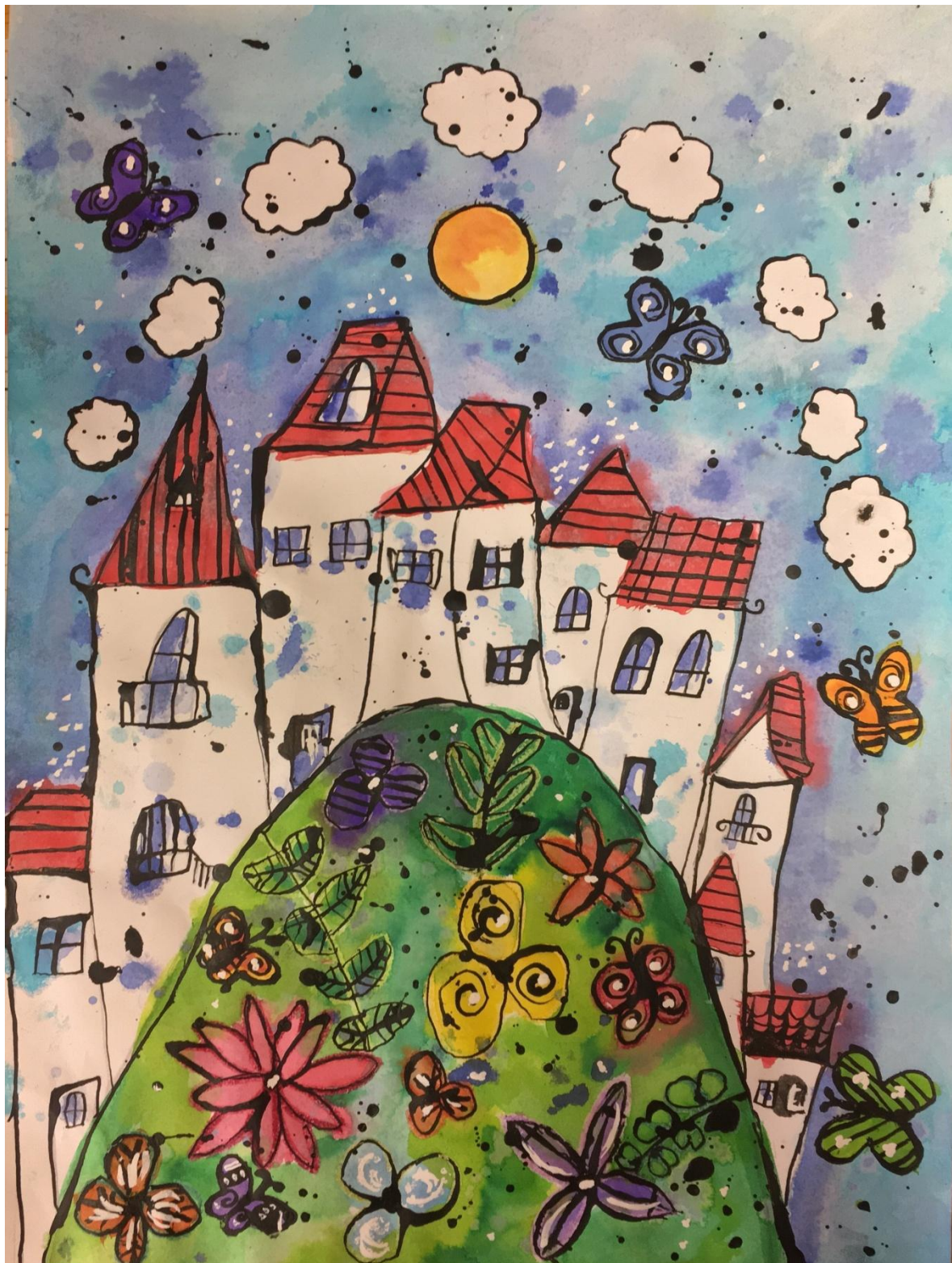
Zuzana Szeredyová – I. kategória, ZŠ, Pribinova 1, Zlaté Moravce