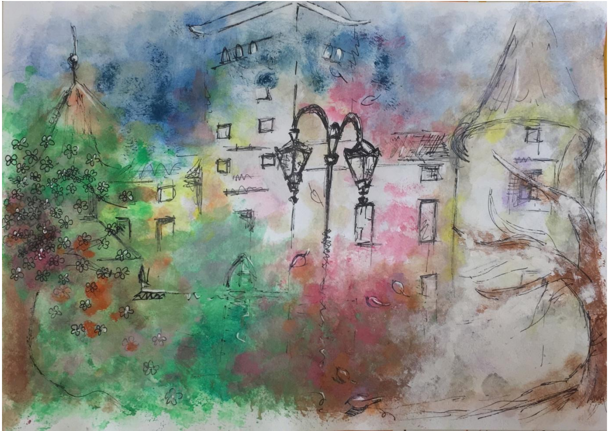
Katarína Papíková – 1. miesto, III. kategória ZŠ, Ulica mieru 1235, Bytča