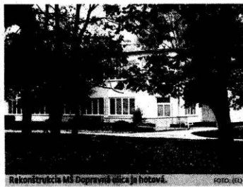
Rekonštrukcia MŠ Doppravnej ulice je hotová.

„Práce realizovala na základe verejného obstarávania spoločnosť Levstav Levice, náklady na rekonštrukciu boli vo výške 320-tisíc eur,“ doplnila s tým, že náklady znášala samospráva zo svojho rozpočtu.