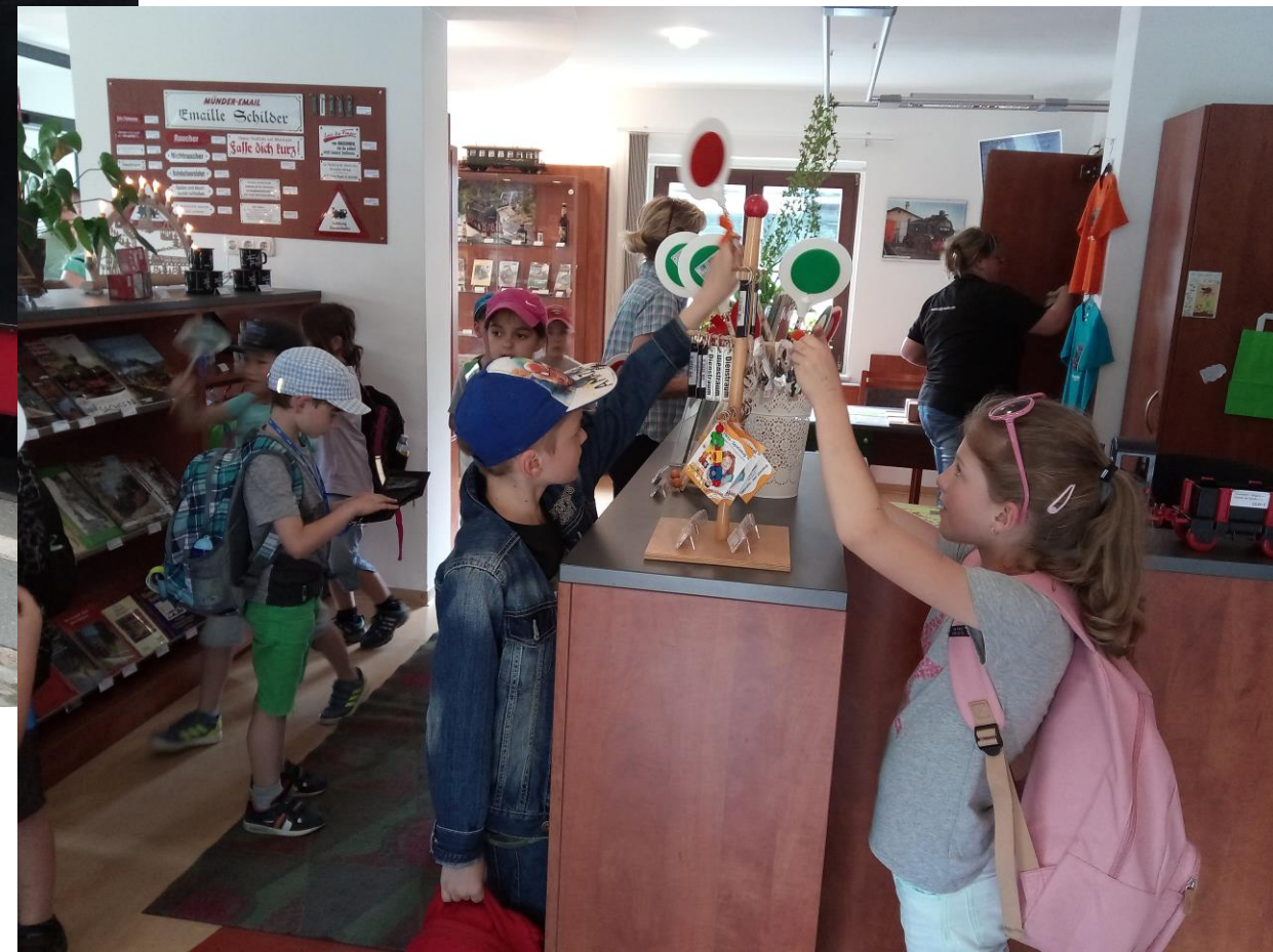
Po příjezdu do Oberwiesenthalu si děti nakoupily v místním infocentru suvenýry. Nejoblíbenějším suvenýrem byla plácačka výpravčího s bonbonky.