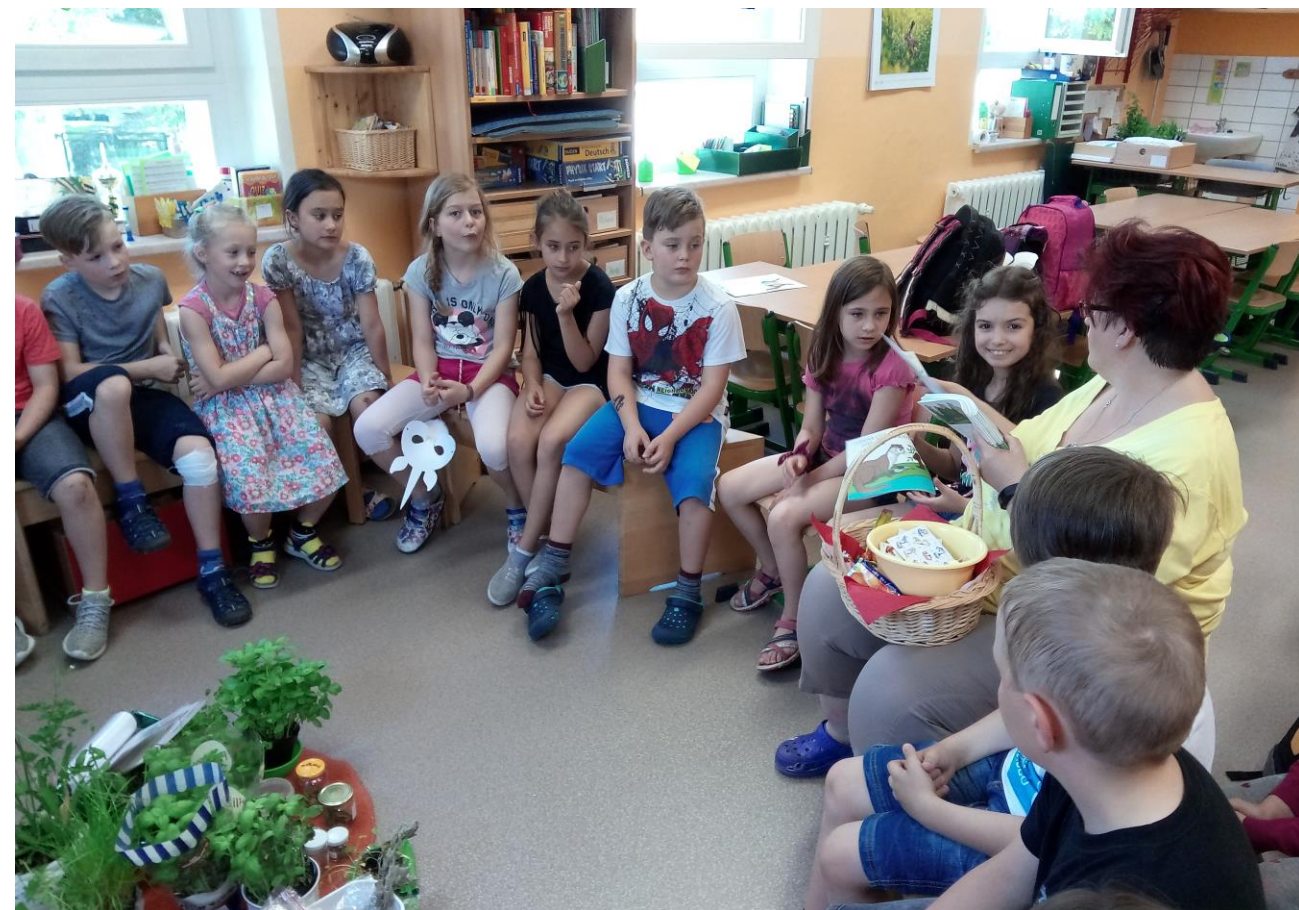
Gong ohlásil konec soutěžení. Děti se pak shromáždily v jednotlivých třídách – mezi nimi byly i naše děti. Proběhlo zhodnocení a všechny děti dostaly sladkou odměnu.