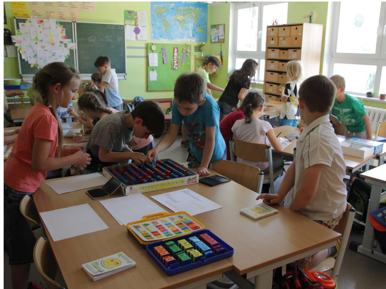
V této třídě se hrály různé stolní hry.