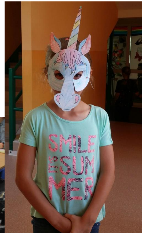
Děti si mohly vyrobit zvířecí masky.