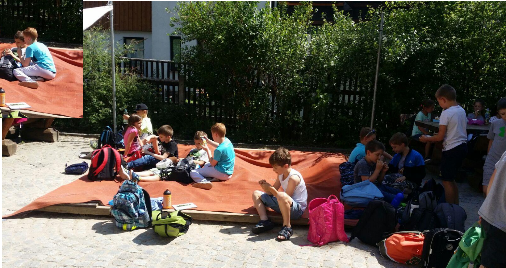
Děti se pak nasvačily na školním dvoře.