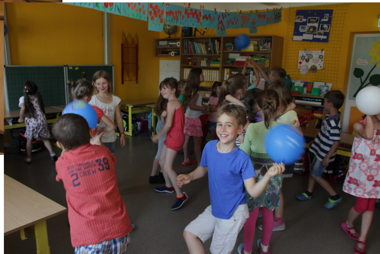
Zde se také tancovalo.