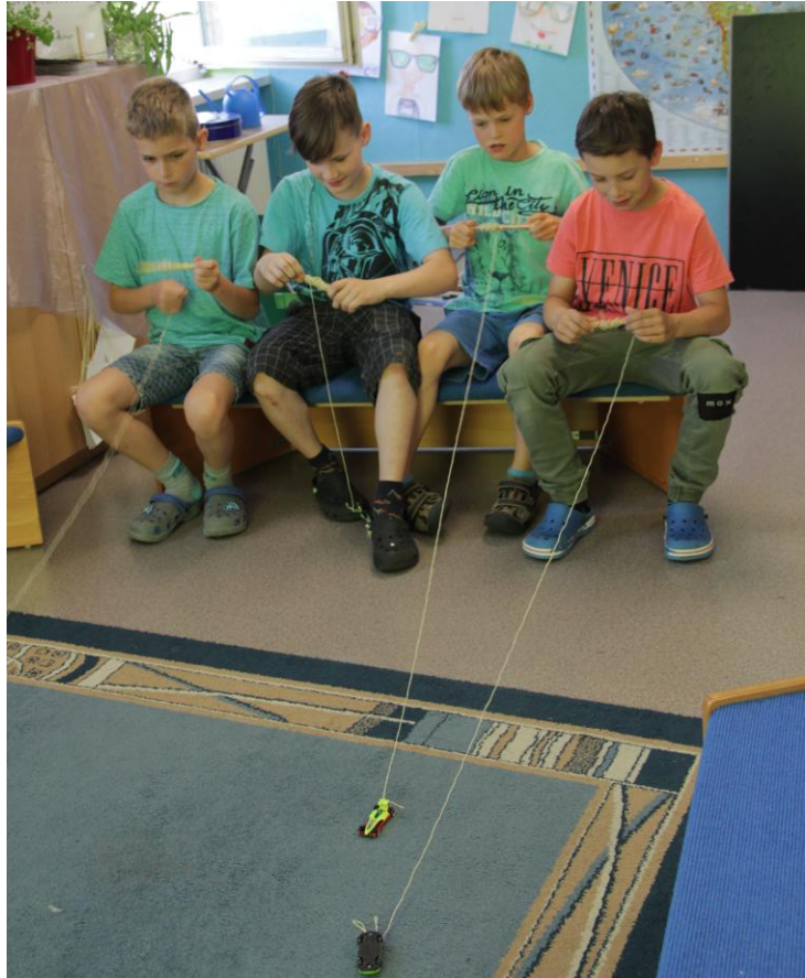
Tady se hrály různé hry na šikovnost.