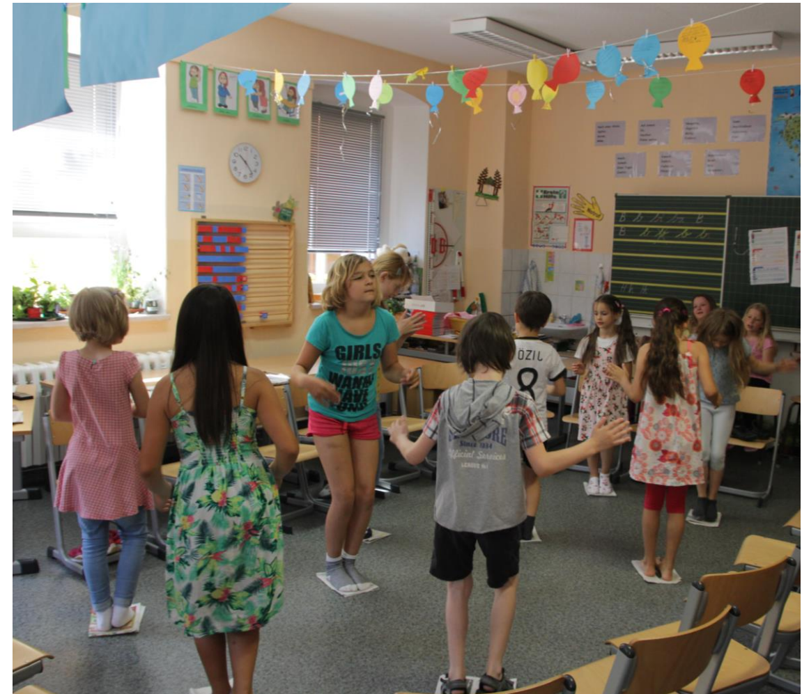
Paní učitelky z obou partnerských škol připravily celkem 12 různých stanovišť, které si děti obcházely samostatně. V této třídě se tancovalo s novinami.