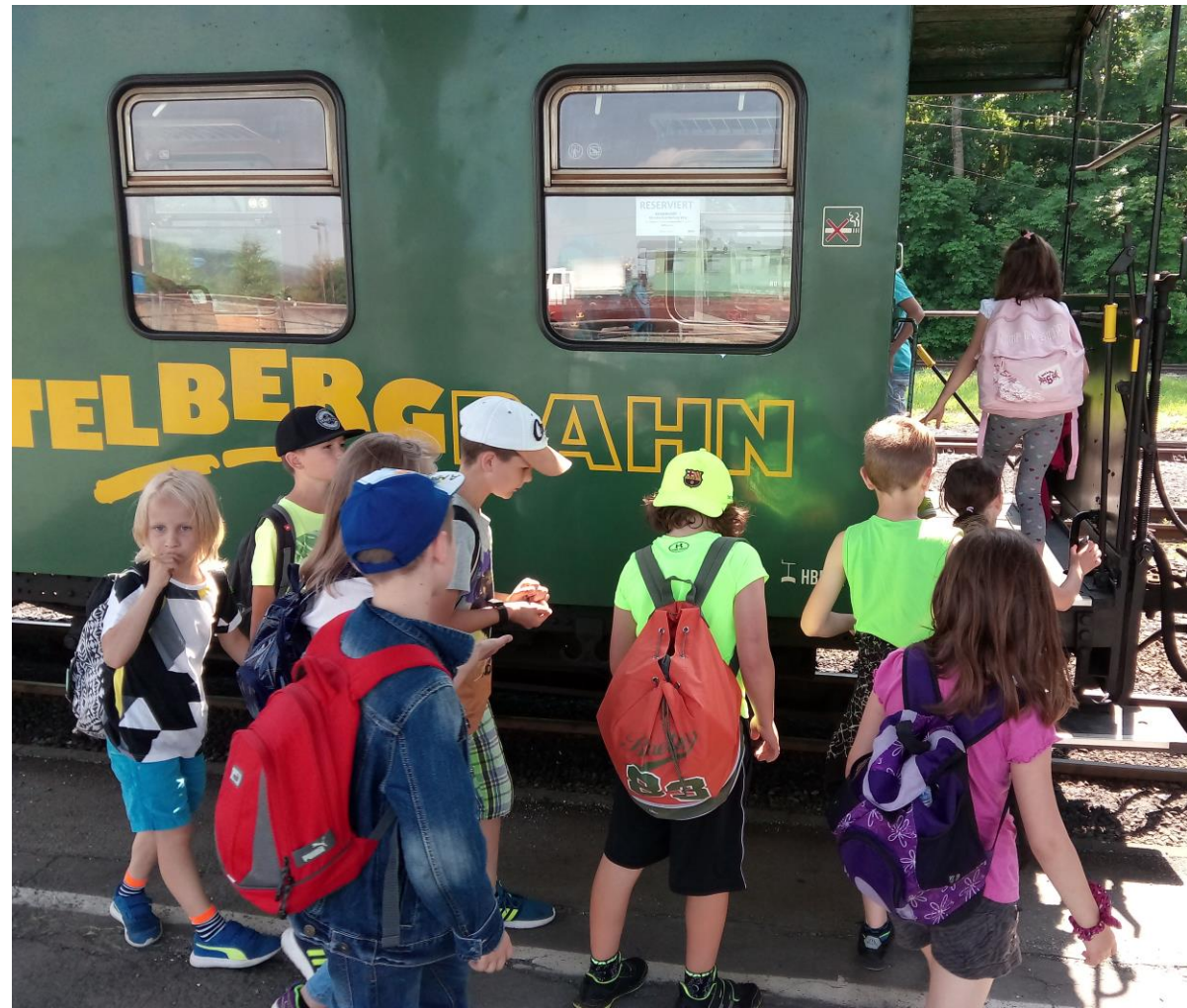
Pak se jelo do Crazahl na parní mašinku.