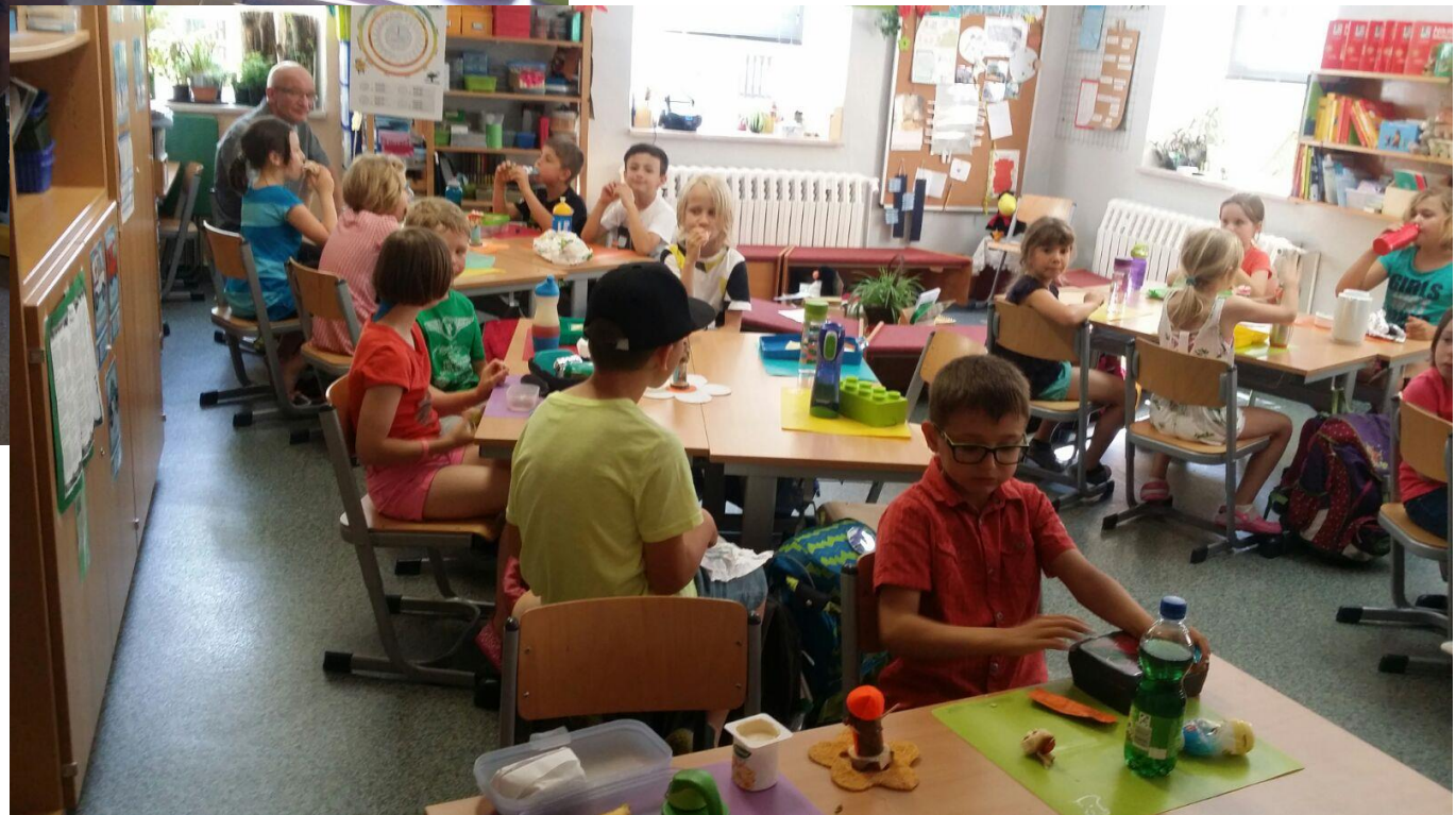
Po našem příjezdu byly děti rozděleny do šesti skupin, ve kterých se české i německé děti společně nasvačily.