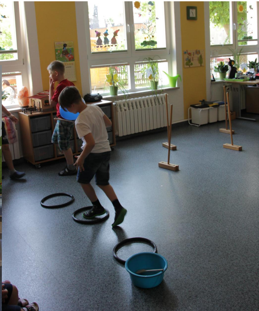
V jedné třídě byla připravena překážková dráha, která nebyla vůbec jednoduchá. Dráhu musely děti absolvovat s balónkem na vařečce.