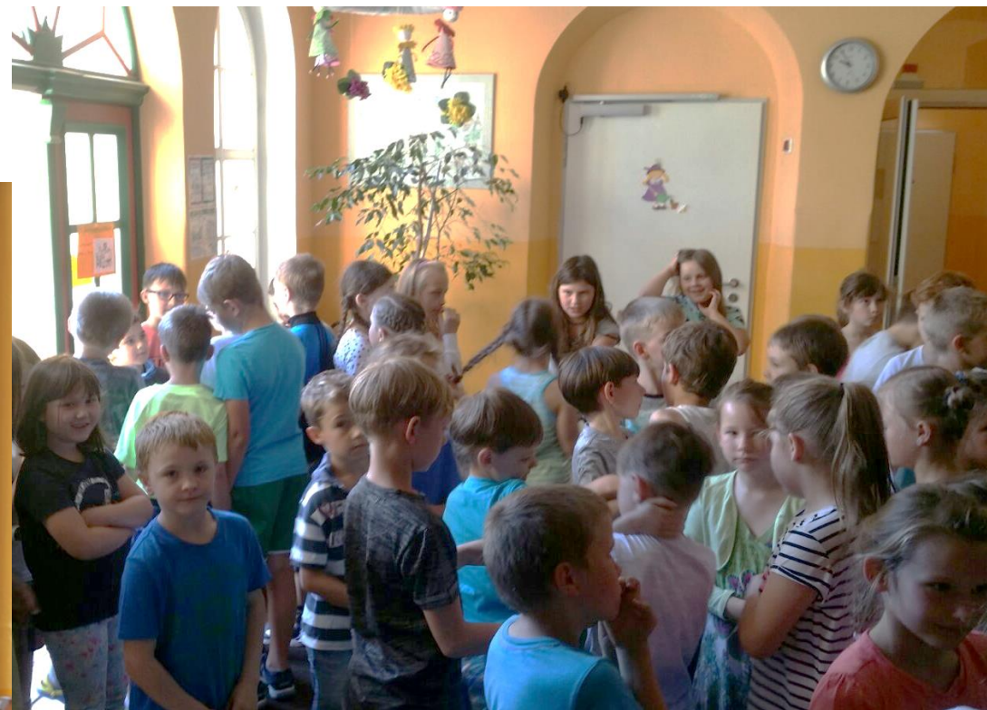
Po společné svačince se všechny děti shromáždily v hale, kde se dozvěděly podrobnosti o průběhu setkání. Děti bylo kolem 130.