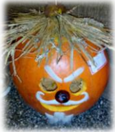
Európska noc výskumníkov