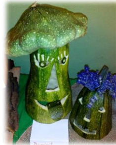
Noc v škole