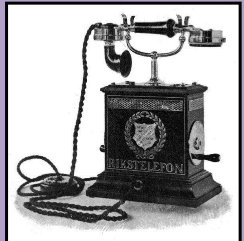
Telefón z roku 1896 /Švédsko/