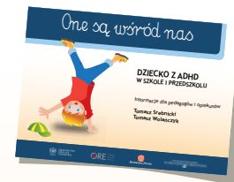
DZIECKO Z ADHD W SZKOLE I PRZEDSZKOLU