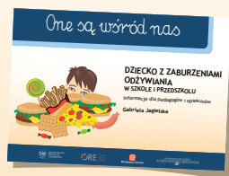
DZIECKO Z ZABURZENIAMI ODŻYWIANIA W SZKOLE I PRZEDSZKOLU