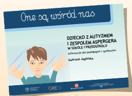
DZIECKO Z AUTYZMEM I ZESPOŁEM ASPERGERA W SZKOLE I PRZEDSZKOLU