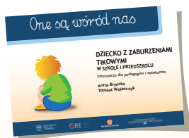
DZIECKO Z ZABURZENIAMI TIKOWYMI W SZKOLE I PRZEDSZKOLU

W drugiej serii „One są wśród nas” ukazały się: