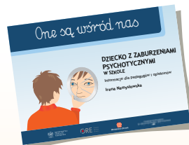
DZIECKO Z ZABURZENIAMI PSYCHOTYCZNYMI W SZKOLE