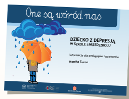
DZIECKO Z DEPRESJĄ W SZKOLE I PRZEDSZKOLU