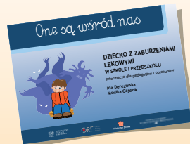
DZIECKO Z ZABURZENIAMI LĘKOWYMI W SZKOLE I PRZEDSZKOLU