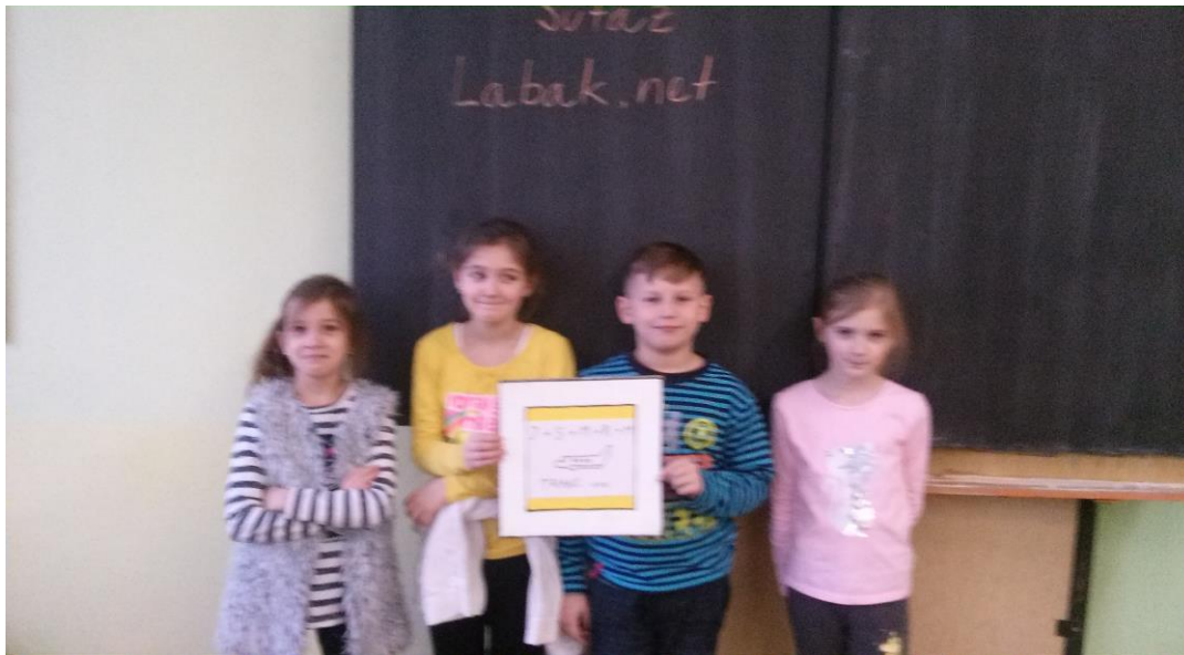
SKUPINA č.2: VEDCI SUPERWizardsi navrhli logo: