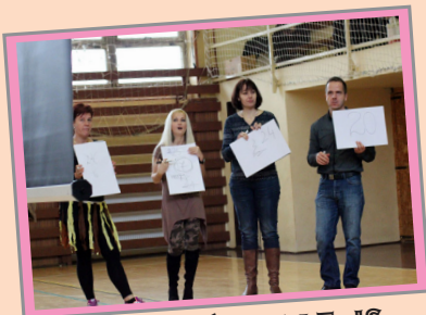
A TANÁROKAT IS FELAVATTUK

A diákparlament tagjaival már szeptembertől nekifogtunk a diáknap előkészítésének. Igyekeztünk minél több kreatív feladatot és ötletes jelmeztémát kitalálni az elsősök avatására. A témák szétosztását a szerencse döntötte el, minden osztály képviselője húzott a lehetséges feladatok közül, s már csak rajtuk állt, hogyan valósítják meg. Az avatás napján mindenki a legjobbat hozta ki magából, nagyon szoros verseny végén született meg a döntés a végső győztest illetően. Az idei év "legjobb osztálya" címet és a nyerteseknek járó tortát az I.D osztály szerezte meg. Gratulálunk nekik! Végezetül a diákparlament nevében szeretnénk megköszönni a segítséget a zsűrinek, a műsorvezetőknek, a tanároknak, akik hozzájárultak a rendezvény sikeréhez!